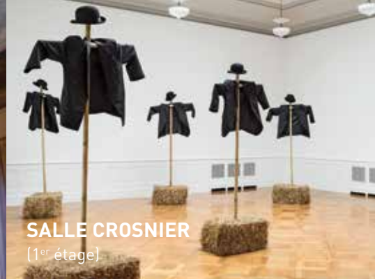
SALLE CROSNIER [1 er étage]

DIMENSIONS 10 m x 12 m SURFACE 120 m 2 (scène 20 m 2 )