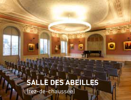
SALLE DES ABEILLES [rez-de-chaussée]