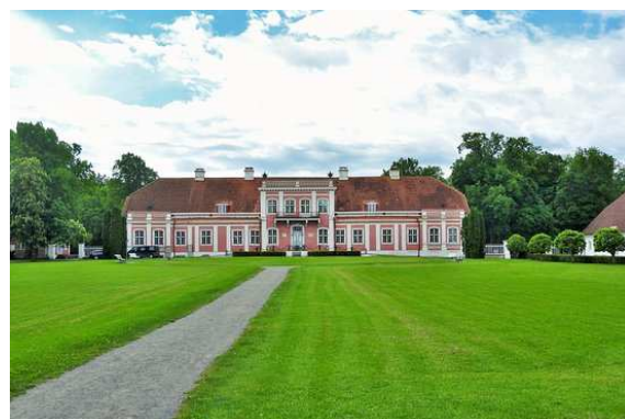
Parc national Lahemaa – Manoir Sagadi