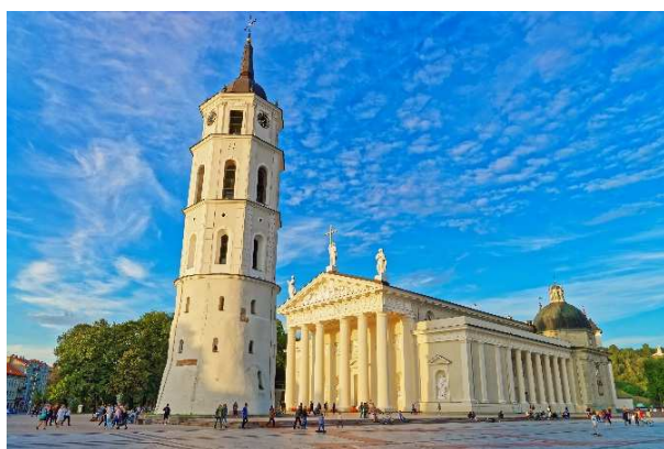
Cathédrale de Vilnius

Capitale baroque du duché de Lituanie, fondée au 14 e siècle, Vilnius , grand comptoir commercial au siècle suivant, devint le centre géographique de l'Europe, surnommée la Jérusalem du Nord par la communauté juive d'avant-guerre. Visite de la vieille ville , inscrite à l'Unesco, qui dévoile ses charmes par le labyrinthe de ses rues pavées et la magnificence de ses églises baroques. Déjeuner en ville. L'après-midi, excursion à Trakai , l'ancienne capitale du grand-duché de Lituanie jusqu'en 1323. Admirablement situé sur une île du lac Galve, le château succomba aux assauts des chevaliers Teutoniques. Il a été entièrement restauré. Dîner et soirée libres.