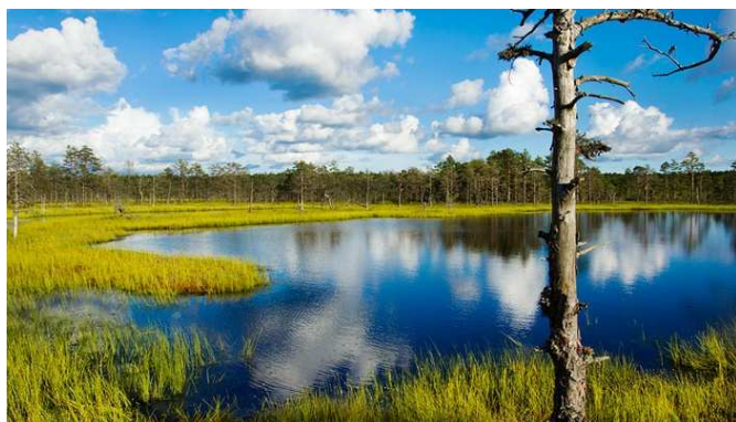
Parc national Lahemaa

Excursion vers les bords du golfe de Finlande sur le thème de l'Estonie au temps des barons baltes dans le Parc national de Lahemaa . Outre sa faune et sa flore préservées, il abrite plusieurs manoirs, demeures germaniques du 18 e siècle qui ne sont pas sans rappeler les villas de Vénétie. Visite du manoir Sagadi . Déjeuner au manoir Vihula . Retour dans l'après-midi et promenade dans la Ville Basse, seconde partie du centre historique. Dîner et soirée libres.