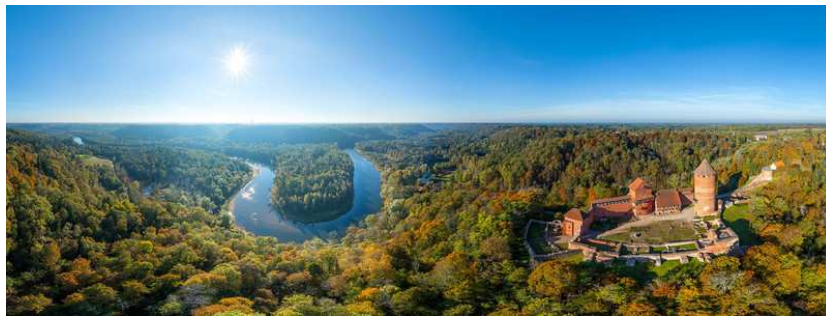
Parc national Gauja – Château Turaida