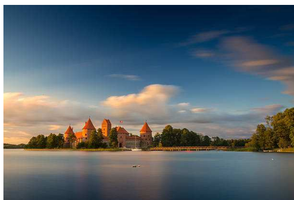
Château de Trakai